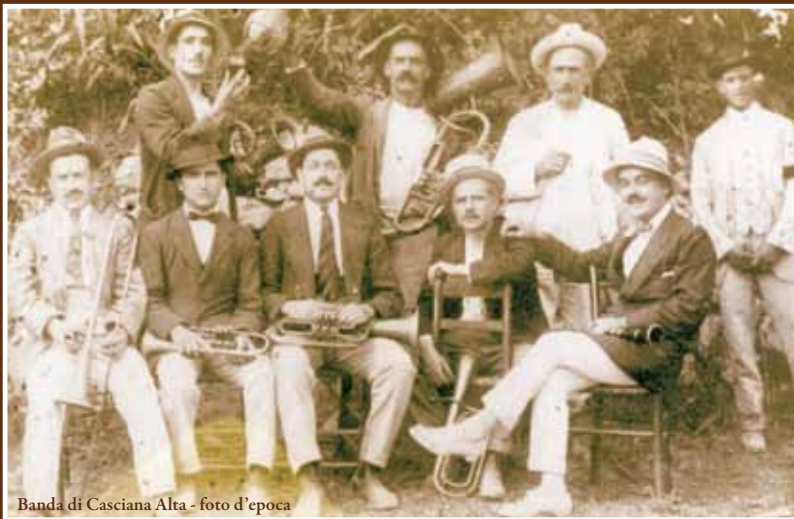
Banda di Casciana Alta - foto d'epoca

STAGIONE SPETTACOLI OTTOBRE 2015 - APRILE 2016 TEATRO - MUSICA - TEATRO PER BAMBINI - LABORATORI WWW.LACOMPAGNIADDEL BOSCO.IT